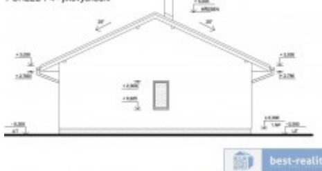
POHLED P4 - jihovýchodní