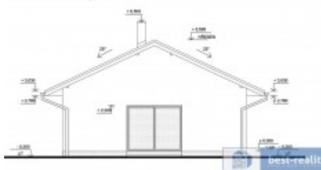
POHLED P3 - severozápadní